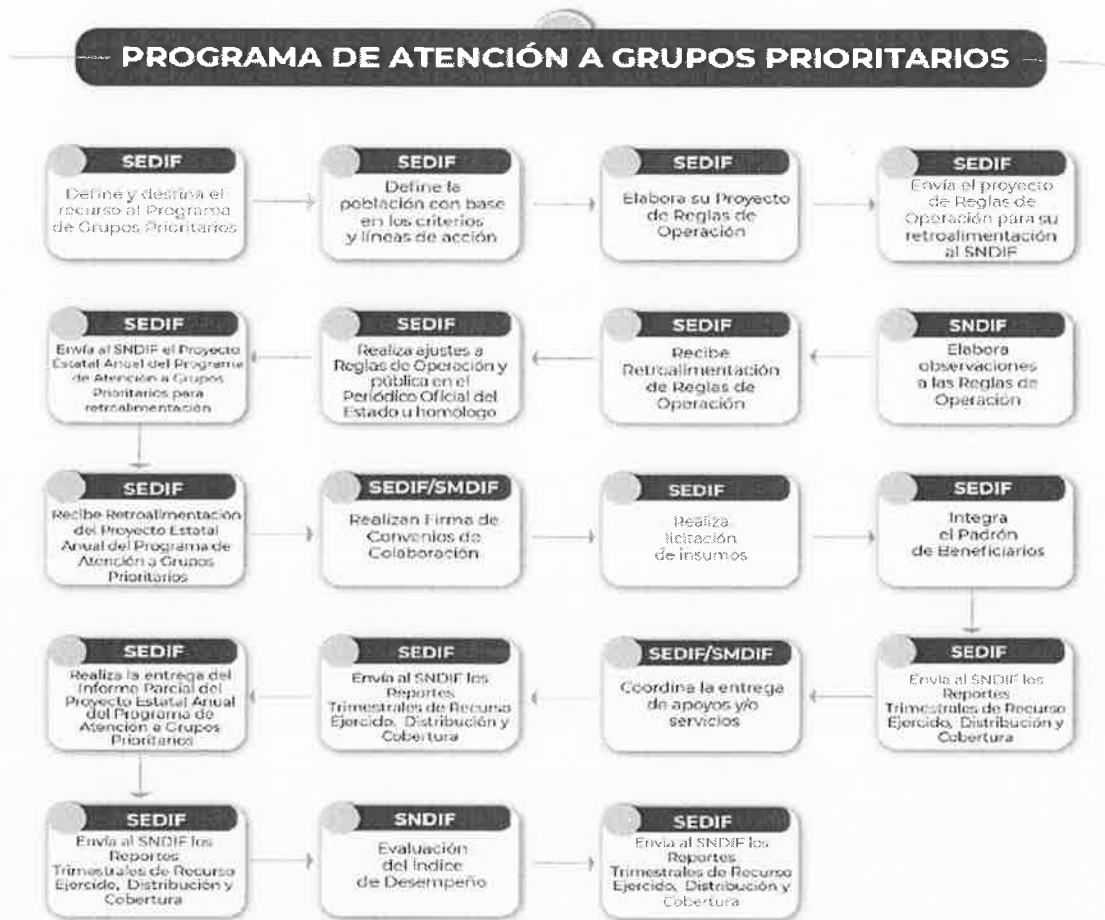
Figura 3. Esquema del Programa de Atención a Grupos Prioritarios.